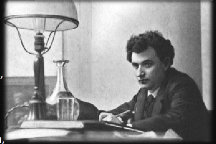
Г.Е. Зиновьев – первый председатель исполкома КИ

Одни считали, что необходимо закрепить успехи путем постепенных реформ, а другие призывали к активным действиям, взятию власти по примеру большевиков.