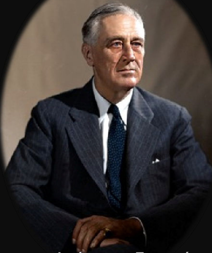
Фрэнклин Делано Рузвельт